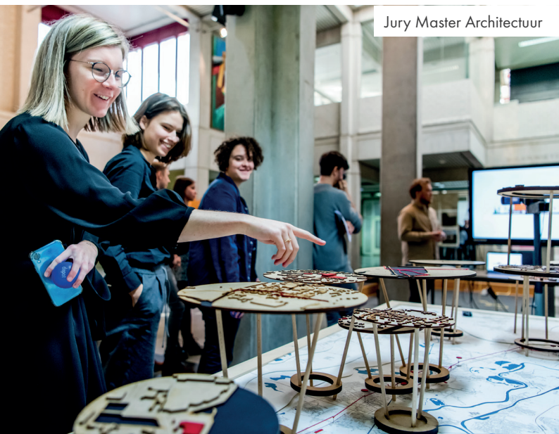
Jury Master Architectuur